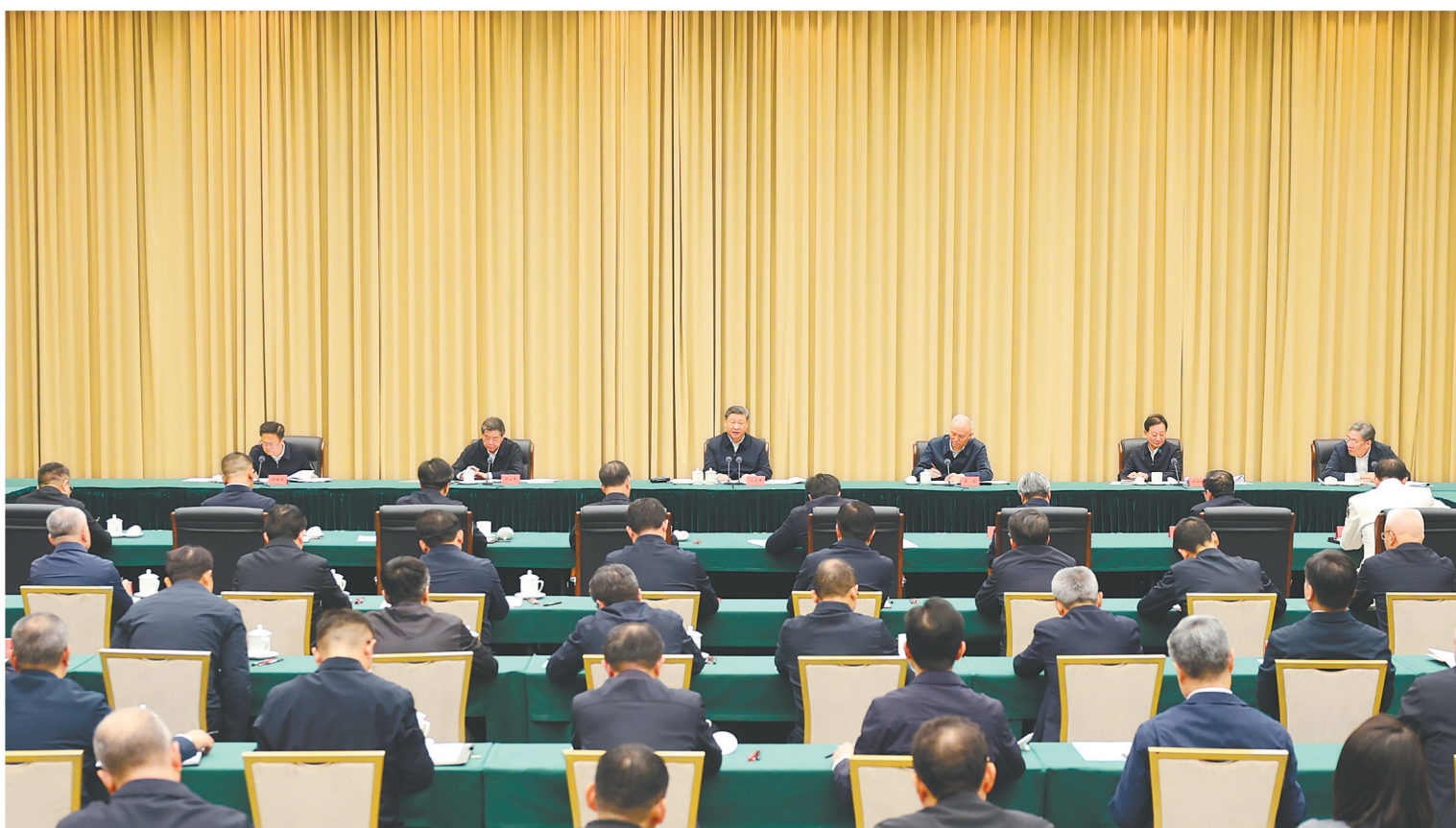
12月17日下午，中共中央总书记、国家主席、中央军委主席习近平在海南三亚听取海南省委和省政府工作汇报，发表了重要讲话。

习近平强调，要全面贯彻党的二十大和二十届二中、三中全会精神，认真落实党中央关于海南自由贸易港建设的各项部署，紧紧围绕建设全面深化改革开放试验区、国家生态文明试验区、国际旅游消费中心、国家重大战略服务保障区的战略定位，科学谋划封关前后的改革开放和高质量发展工作，继续解放思想、开拓创新，攻坚克难、稳步推进，努力把海南自由贸易港打造成为引领我国新时代对外开放的重要门户，奋力谱写中国式现代化海南篇章。