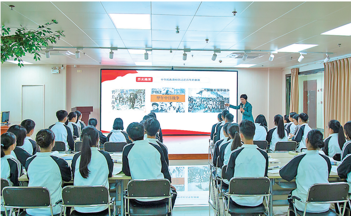
▲旅游服务与管理大专班学生在上课。

据该校相关负责人介绍，“3+2”人才培养模式为学生打通了成长的通道，圆了许多学生的大学梦，他们只需5年时间就能获得大专学历，比同届学生少上一年大学。同时，“3+2”联合办学专业技能专业性更强，就业更具竞争力，这也是这些专业毕业生在就业市场上就业成功率较高的主要原因之一。（儋州融媒全媒体记者符武月）