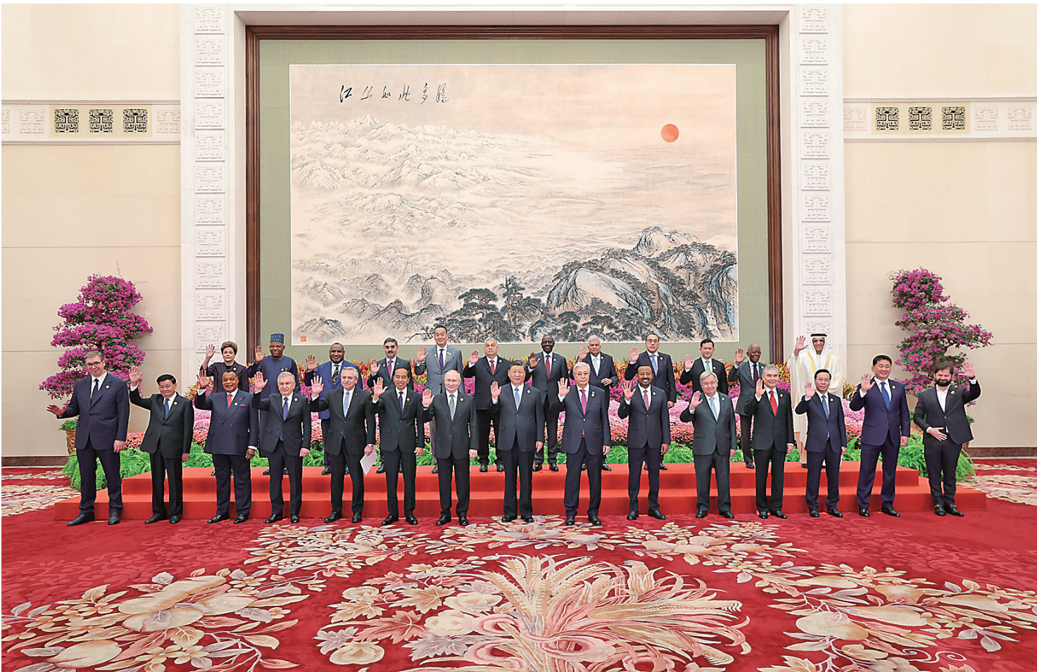
10月18日上午,国家主席习近平在北京人民大会堂出席第三届“一带一路”国际合作高峰论坛开幕式并发表题为《建设开放包容、互联互通、共同发展的世界》的主旨演讲。这是会前,习近平同出席高峰论坛的外国国家元首、政府首脑和国际组织负责人等国际贵宾集体合影。

10月18日上午,国家主席习近平在人民大会堂出席第三届“一带一路”国际合作高峰论坛开幕式并发表题为《建设开放包容、互联互通、共同发展的世界》的主旨演讲。习近平宣布中国支持高质量共建“一带一路”的八项行动,强调中方愿同各方深化“一带一路”合作伙伴关系,推动共建“一带一路”进入高质量发展的新阶段,为实现世界各国的现代化作出不懈努力。