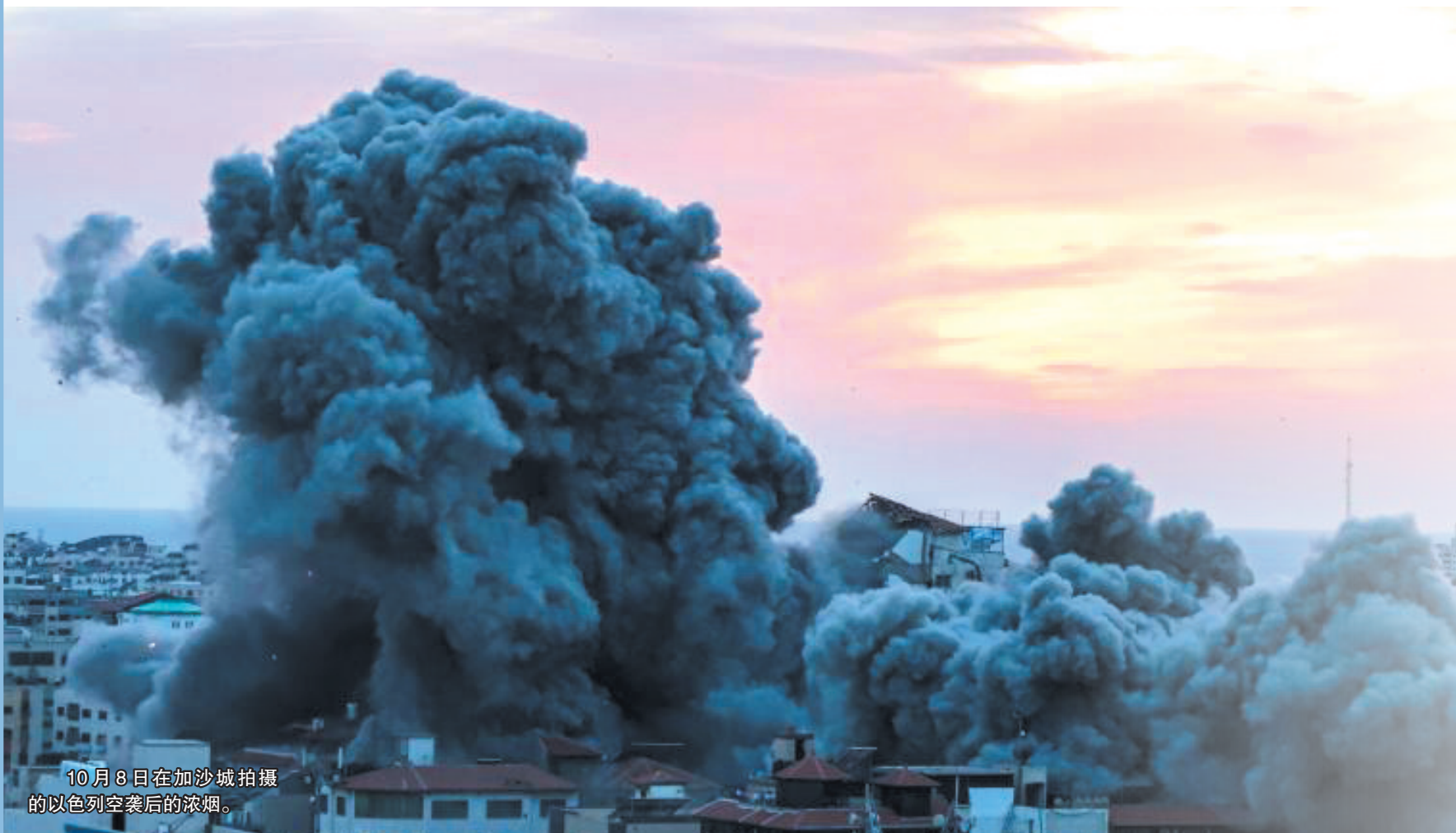
10月8日在加沙城拍摄的以色列空袭后的浓烟。