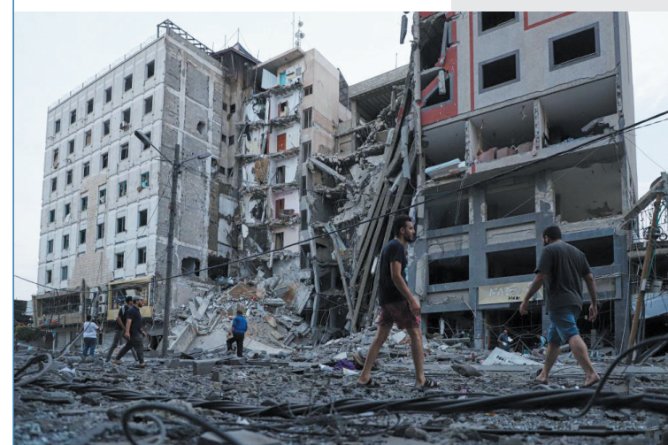
▲10月8日,巴勒斯坦人在加沙城查看以色列空袭后的建筑废墟。