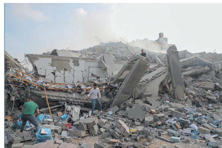
▲10月8日,在加沙城,巴勒斯坦人查看以色列空袭后的建筑废墟。