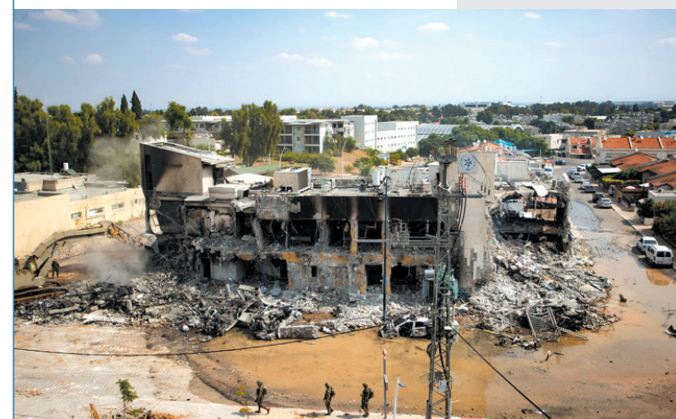
▲10月8日,在以色列南部城市斯代罗特,以军将哈马斯武装人员曾躲藏的警察局办公楼拆除。