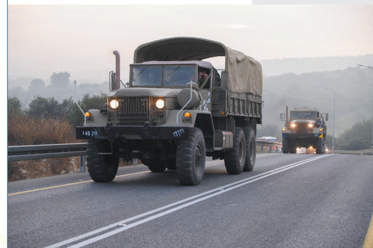
▲10月8日,以色列军用车在北部靠近黎巴嫩边境区域的道路上行驶。