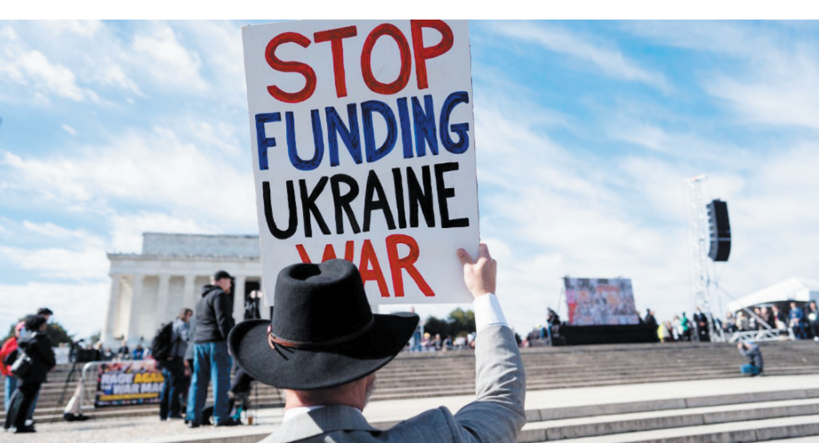
▲2月19日,在美国首都华盛顿,一名抗议者手举标语在林肯纪念堂前参加集会,抗议者要求美国停止煽动俄乌冲突、促进双方和谈、解散北大西洋公约组织(北约)、削减美国军费等等。