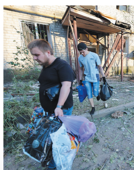
▲2022年6月20日,顿涅茨克当地居民从被损坏的建筑撤离。

俄罗斯驻美国大使阿纳托利·安东诺夫22日说,北约向乌克兰提供F-16战机,更加坐实其介入俄乌冲突的程度之深。(据新华网)