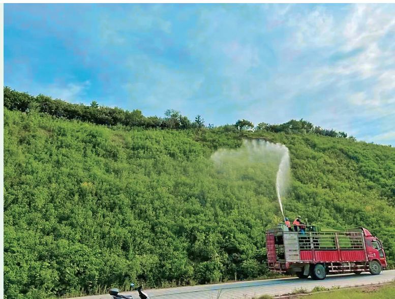
▲工人在养护生态复绿面。

秦海南和中国电建集团北京勘测设计研究院有限公司项目设计负责人李准密切对接,借鉴吸收业内先进经验,经过反复试验,确定合理可行的施工方案。