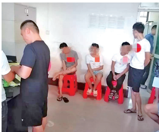
▲自首的电信诈骗嫌疑人在等候处理