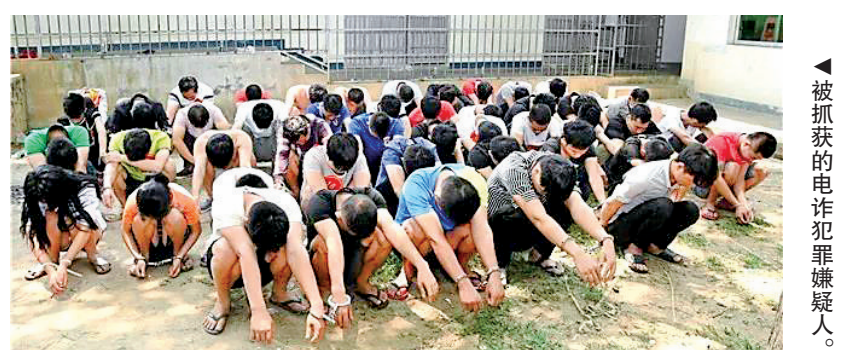
▲被抓获的电信诈骗犯罪嫌疑人。