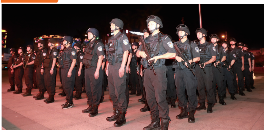
▲公安干警整装待发