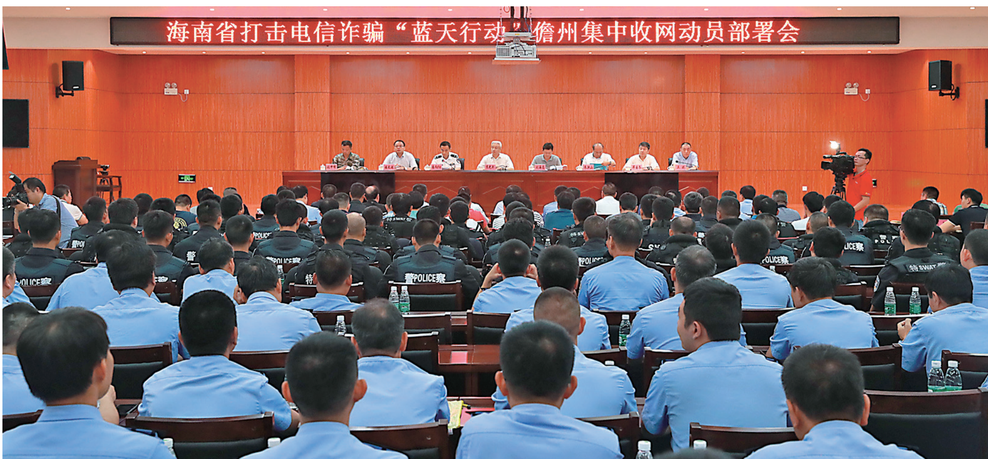
海南省打击电信诈骗“蓝天行动”儋州集中收网动员部署会