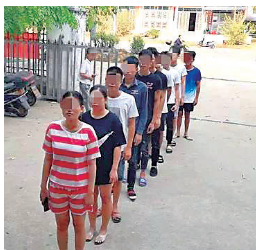
▲电信诈骗嫌疑人排队自首