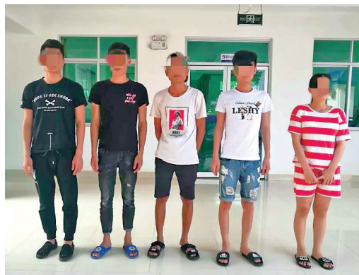
▲自首的电信诈骗嫌疑人