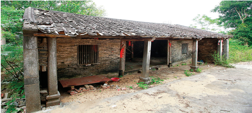
罗杰与张钥共建的“天堂书屋”，位于中和镇天堂村。