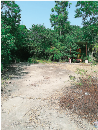
罗杰修建孔庙的遗址，位于中和镇南郊。